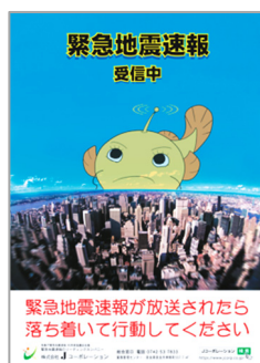
周知広報ポスター A3 サイズ

また、ご希望のお客さまには、年1回交換用の周知広報ポスターを無償でお送りいたします。